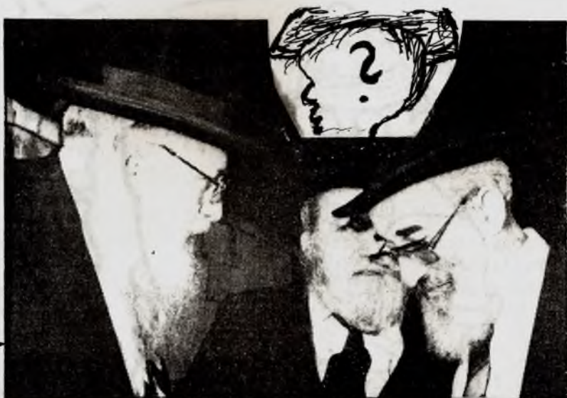
נציגות האל עלי אדמות